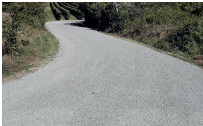
Texte et photo : Vincent Lafaye