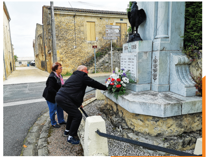
Commémoration du 8 Mai en tout petit comité pendant le confinement