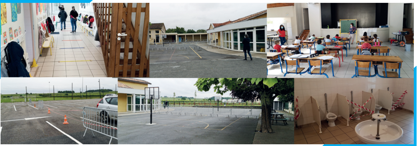
Le déconfinement, la reprise scolaire et la nouvelle classe dans le Foyer