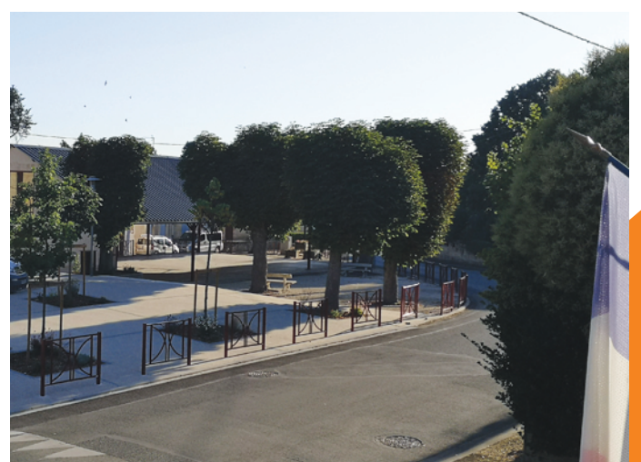
La jolie place de notre village, fleurie et bien équipée !