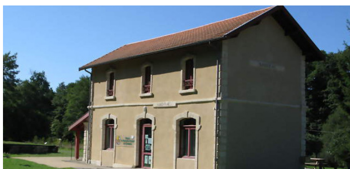
Maison du patrimoine naturel du Créonnais