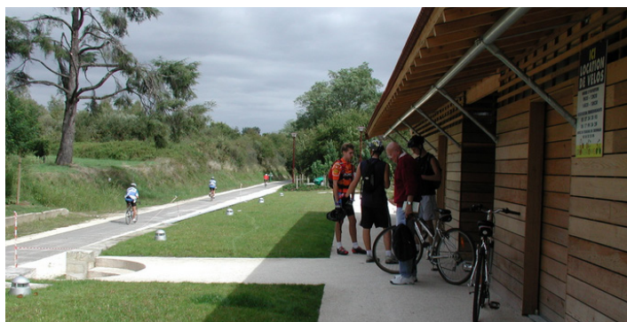
Créon Station Vélo