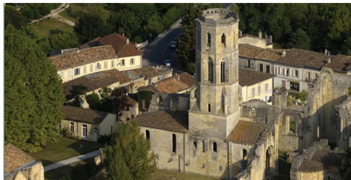
Abbaye de la Sauve-Majeure