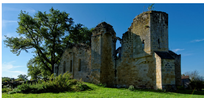
Commanderie de Sallebruneau