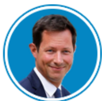
François-Xavier Bellamy (Les Républicains)