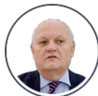
François Asselineau (Union populaire républicaine)