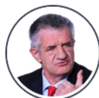
Jean Lassalle (Alliance rurale)