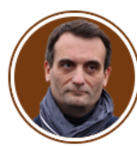
Florian Philippot (Les Patriotes)