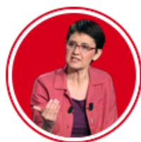
Nathalie Arthaud (Lutte ouvrière)