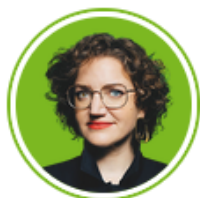
Marie Toussaint (Les Ecologistes - Europe Écologie)