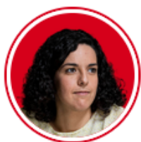
Manon Aubry (La France insoumise)