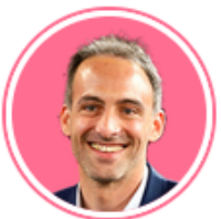
Raphaël Glucksmann (Place publique - Parti socialiste)