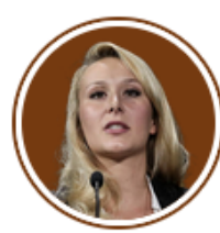
Marion Maréchal (Reconquête !)